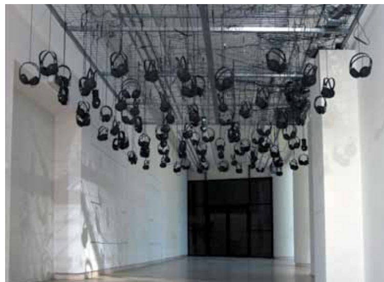
Suspect device , 2007 Ηχητική εγκατάσταση