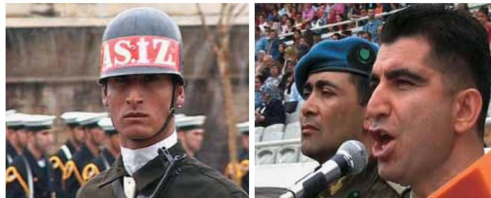
I, Soldier [Εγώ, ο Στρατιώτης], 2005 Δικάναλη βιντεοεγκατάσταση