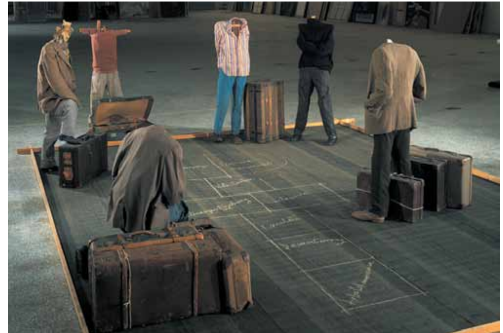
Το κουτσό, 1974 Περιβάλλον