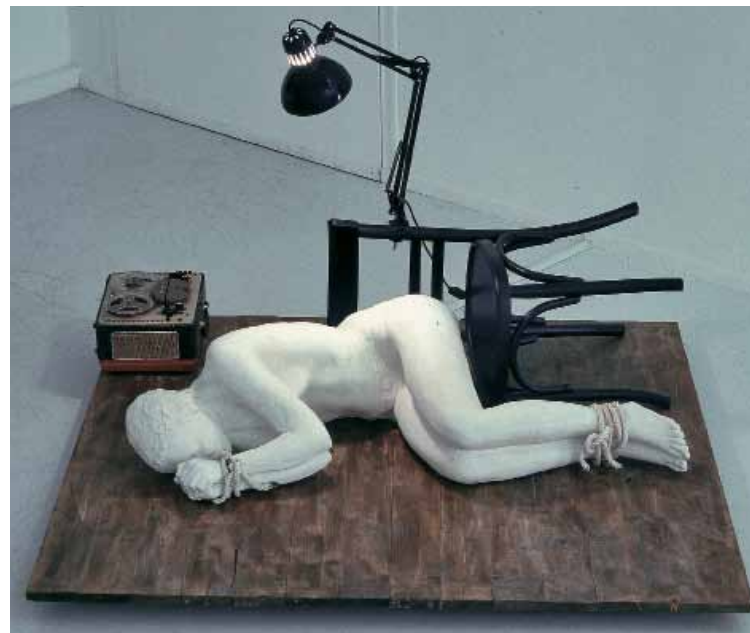
Συμβάν , 1973 Εγκατάσταση