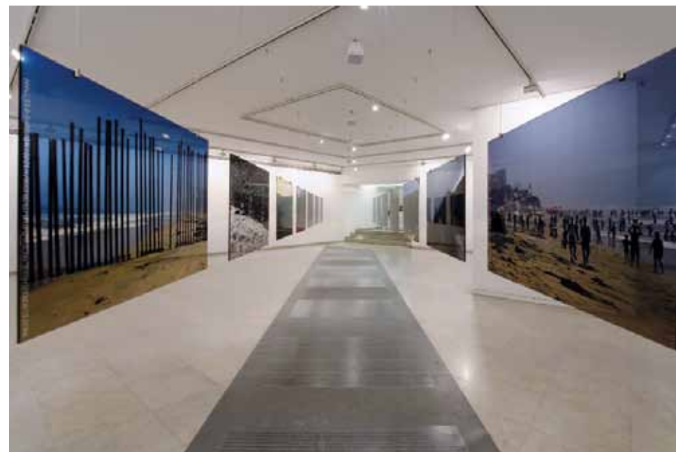
CUT-7 Διαχωριστικές Γραμμές, 2007 Εγκατάσταση