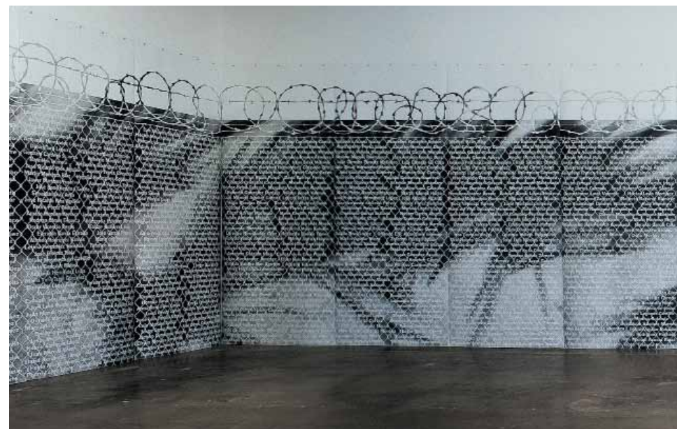
No Olvidado (Not Forgotten) [Όχι ξεχασμένοι], 2010 Γραφίτης σε χαρτί

Για τη δημιουργία του, η καλλιτέχνης επέλεξε να χρησιμοποιήσει γραφίτη και χαρτί, δηλαδή υλικά εύθραυστα, ελαφριά και εφήμερα, σε αντίθεση με το μάρμαρο ή τα άλλα σκληρά και ανθεκτικά υλικά από τα οποία δημιουργούνται τα δημόσια μνημεία.