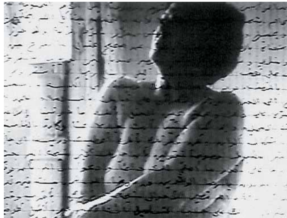
Measures of distance [Μέτρα απόστασης], 1988 Βιντεοταινία

Παρατηρήστε ότι οι εικόνες της μητέρας παρουσιάζονται πίσω από ένα συρματοπλέγμα, πάνω στο οποίο προβάλλεται η αραβική γραφή των επιστολών.