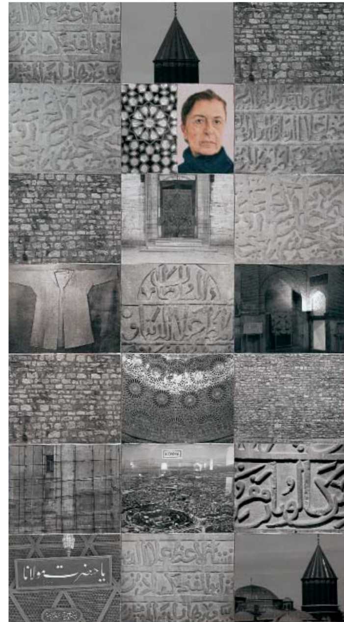
Ικόνιο, 2007. Λάδι σε φωτογραφικές εκτυπώσεις Iris πάνω σε χαρτί arches, 408,9 x 221 εκ. (161 x 87 ίντσες)