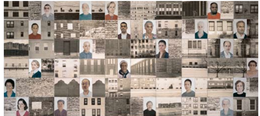
Ξηρά Γη, 1999-2004. Φωτογραφικές εκτυπώσεις Iris και ελαιογραφία σε χαρτί arches, 340,4 x 751,8 εκ. (134 x 296 ίντσες)