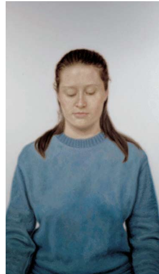
Χωρίς τίτλο (Κορίτσι με μπλε πουλόβερ II), 2008. Λάδι σε καμβά, 274,3 x 157,5 εκ. (108 x 62 ίντσες)

Παρατηρείστε ότι ο Υ.Ζ. Κάμι δε ζωγραφίζει εξιδανικευμένες ανθρώπινες μορφές, αλλά πρόσωπα σηματοδεδεμένα από το πέρασμα του χρόνου, τις εμπειρίες και τα βιώματα. Παρουσιάζει ιδιαίτερες, ξεχωριστές φυσιογνωμίες, με τη μοναδικότητα της ύπαρξης, της ιστορίας τους.