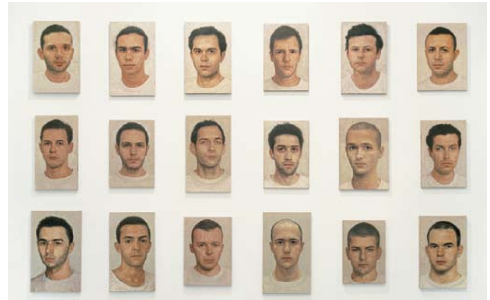
Χωρίς τίτλο (18 Πορτρέτα), 1996, Λάδι σε λινό. Συνολικές διαστάσεις: 243,6 x 307,3 εκ. (96 x 121 ίντσες)