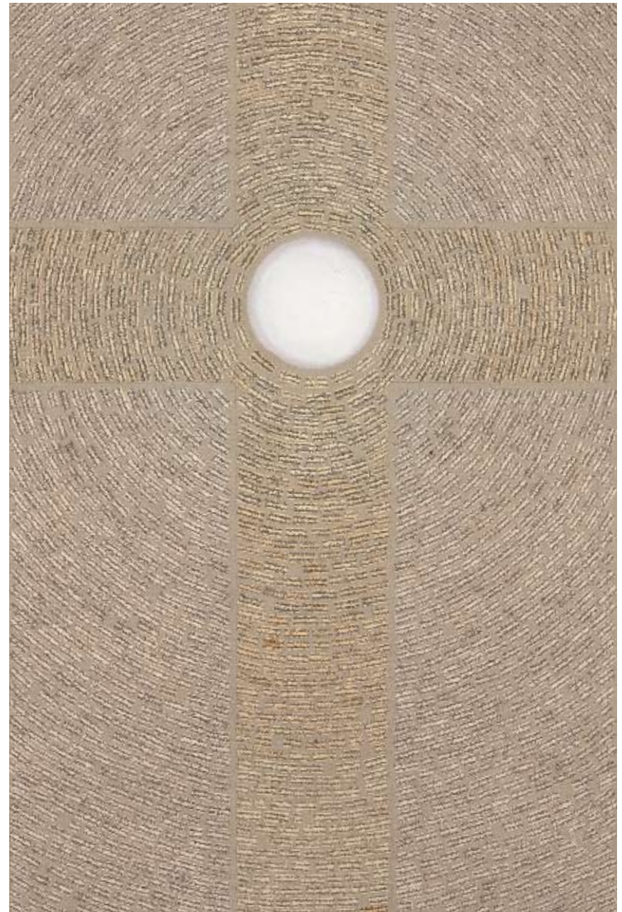
Ατέρμονες προσευχές XIV, 2007, Μικτή τεχνική σε λινό, 144,8 x 96,5 εκ. (57 x 38 ίντσες)