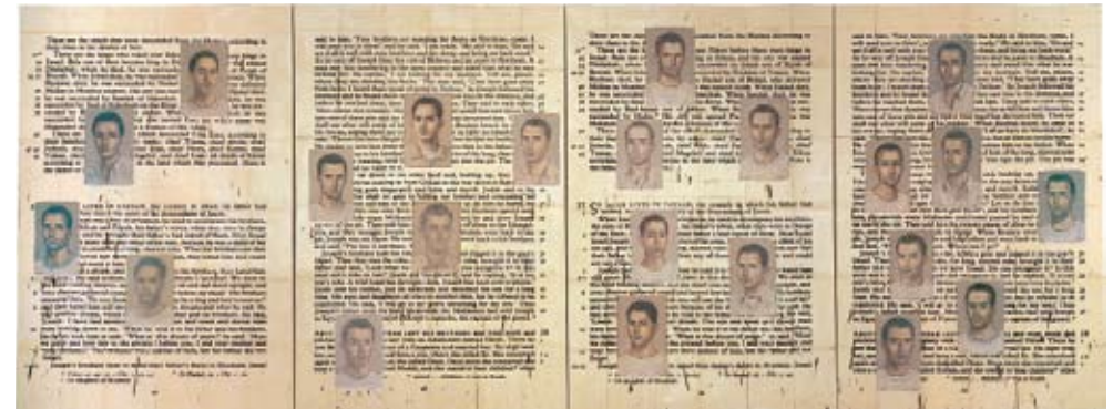
Ιωσήφ, 1992, Λάδι και εγκαυστική σε φωτογραφίες πάνω σε καμβά, 233,7 x 629,9 εκ. (94 x 248 ίντσες)