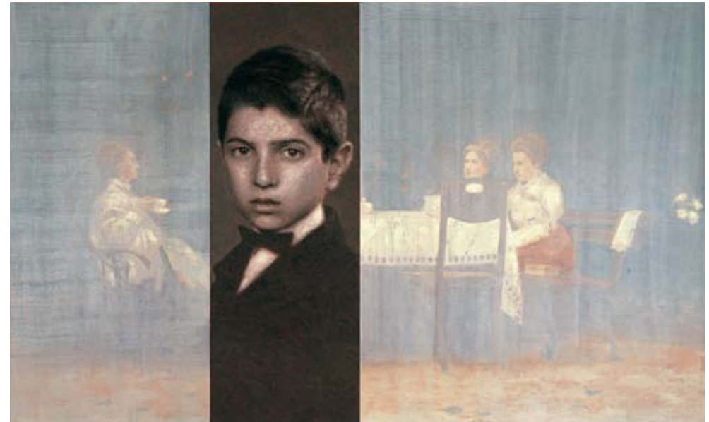
Αυτοπροσωπογραφία ως παιδί, 1990, Λάδι σε καμβά, 205,7 x 335,3 εκ. (81 x 132 ίντσες)

Το έργο με τίτλο Self-Portrait as a Child , που συνθέτουν τρεις πίνακες, ο ένας πλάι στον άλλο, αποτελεί μια ζωγραφική εκδοχή της φωτογραφίας. Στον μεσαίο πίνακα παρουσιάζεται ο ίδιος ο καλλιτέχνης, όπως απεικονιζόταν στην παιδική του φωτογραφία, με επίσημο, αυστηρό ντύσιμο και παπιγιόν. Πλάι του, στους δυο ακριανούς πίνακες, παρουσιάζονται γυναικείες φιγούρες γύρω από ένα τραπέζι, να πίνουν τσάι.