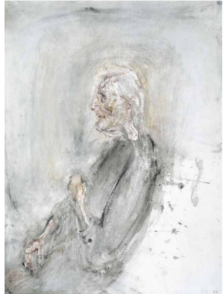
Γριά γυναίκα CIII Αφιέρωμα στον Ουίλερ, 1986 Ακουαρέλα σε χαρτί arches