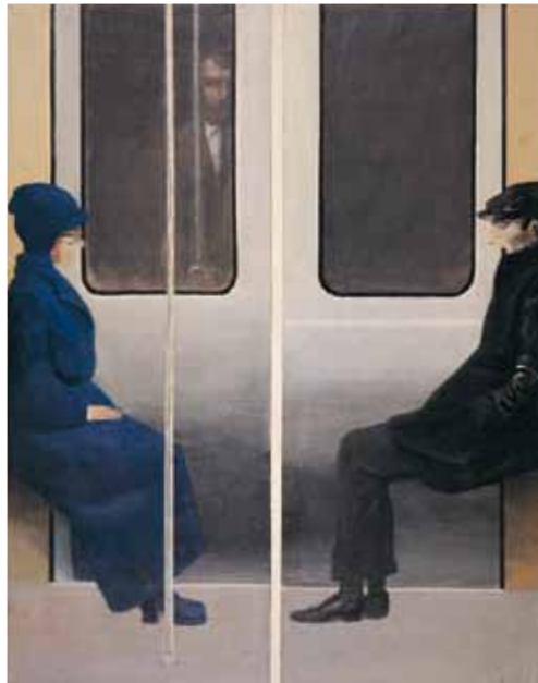
Μετρό Α', 1970 Ακρυλικό σε χαρτί (δίπτυχο)

Η Φρίζα αποτελεί ένα πολύπτυχο έργο που απαρτίζεται από δεκαοκτώ πίνακες οι οποίοι παρατίθενται σε οριζόντια διάταξη, ο ένας πλάι στον άλλο, όπως οι διαφημιστικές αφίσες στο δρόμο και στο μετρό, ή τα κινηματογραφικά καρέ. Εδώ οι εικόνες παρουσιάζουν στιγμιότυπα από τη ζωή, έτσι όπως είχε διαμορφωθεί στην Ελλάδα του '70: