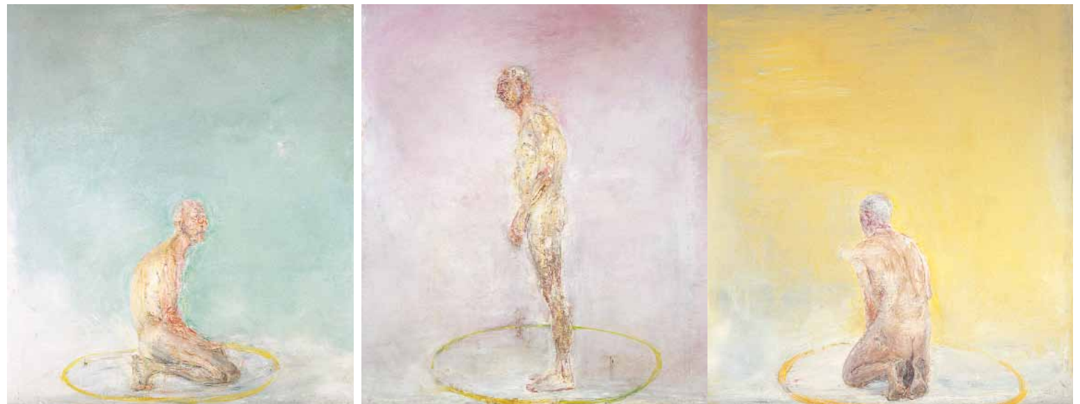
Το τρίπτυχο του κίτρινου κύκλου, 1990 Λάδι σε μουσαμά (τρίπτυχο)