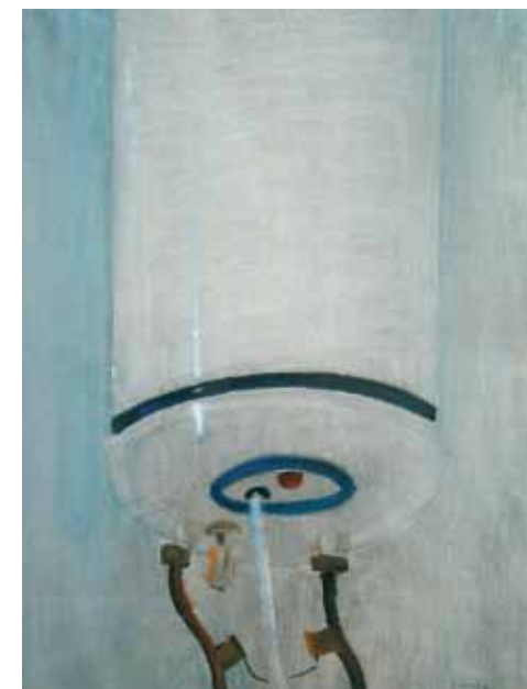
Θερμοσίφωνο, 1963 Τέμπρα σε χαρτί