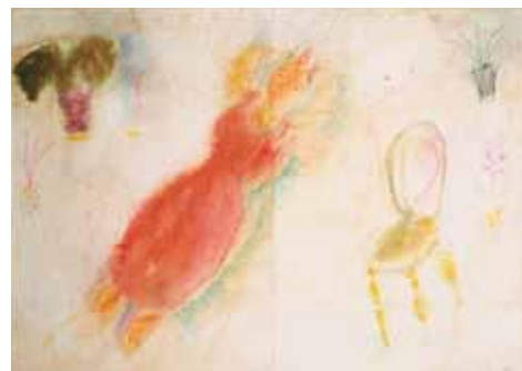
I-IV, Κήποι, 1963 Ακουαρέλα σε χαρτί