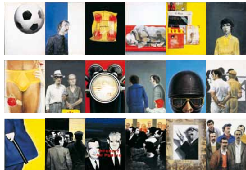
Φρίζα, 1972 18πτυχο Τέμπρα και ακρυλικό σε χαρτί