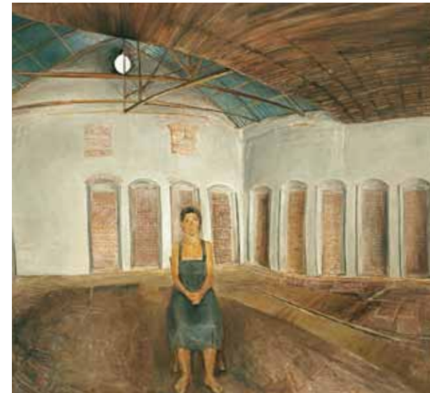
Μεγάλο λιοτριβίο II, 1981 Λάδι σε μουσαμά