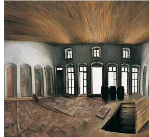
Μεγάλο λιοτριβίο I, 1981 Λάδι σε μουσαμά