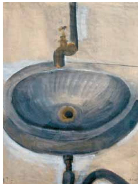
Λαβωμένο, 1963 Τέμπρα σε χαρτί