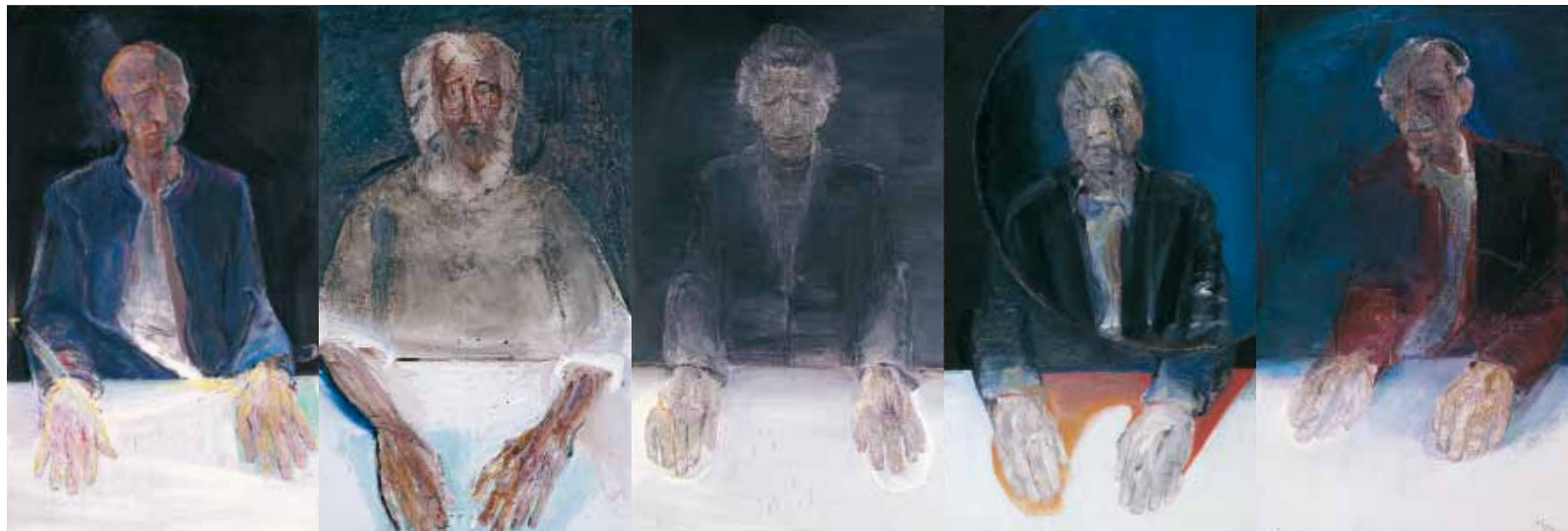
Η τελετή, 2004 Λάδι σε μουσαμά (5 τμήματα)