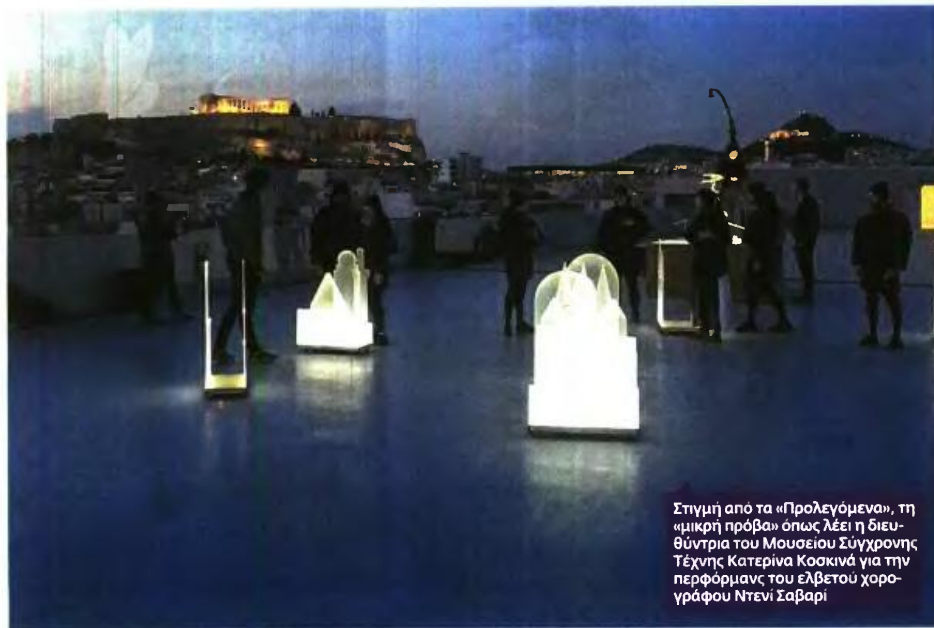
Στιγμή από τα «Προλεγόμενα», τη «μικρή πρόβα» όπως λέει η διευθύντρια του Μουσείου Σύγχρονης Τέχνης Κατερίνα Κοσκινά για την περφόρμανς του ελβετού χορογράφου Ντενί Σαβαρί