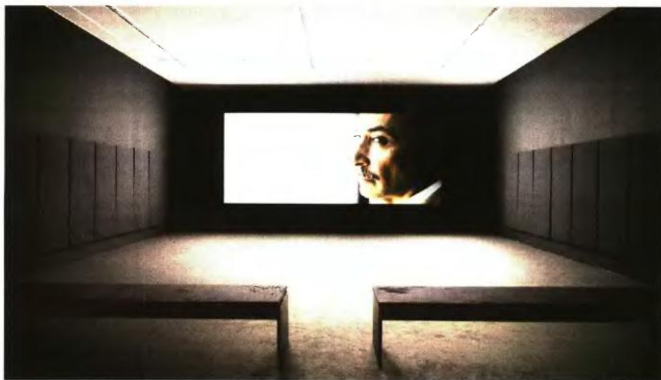
Naeem Mohaleemen, Tripoll Cancelled (Προς Τρίπολη: ακυρώθηκε), 2017, ψηφιακό βίντεο, άποψη εγκατάστασης, ΕΜΕΤ, Αθήνα, documenta 14, φωτ.: Mathias Völzke

σανατολισμός μιας μεγάλης έκθεσης, ιδίως όταν δοκιμάζεται στο περιβάλλον μιας κοινωνίας που βρίσκεται σε πολιτική υπερδιέγερση; Πόσο πολιτική μπορεί να είναι μια πολιτική έκθεση, με άλλα λόγια πόσο μπορεί να απευθυνθεί πολιτικά στο κοινό της; Το δεύτερο επίπεδο αφορά κατά κύριο λόγο τη συνάντησή της με το εικαστικό πεδίο και το πολιτικό και πολιτιστικό περιβάλλον της Ελλάδας. Η συνάντηση αυτή φώτισε λανθάνουσες πτυχές της εγχώριας ζωής και ταυτόχρονα ανέδειξε αδυναμίες της d14, τόσο από επιμελητική όσο και από πολιτική άποψη. Καθώς η έκθεση ακόμη διαρκεί, τουλάχιστον ως προς την γερμανική της πτυχή, στις παρακάτω παρατηρητικές σημειώσεις θα επικεντρωθώ κυρίως στο δεύτερο επίπεδο, επιτρέποντας κάποια υπαινικτικά σχόλια για την έκ-