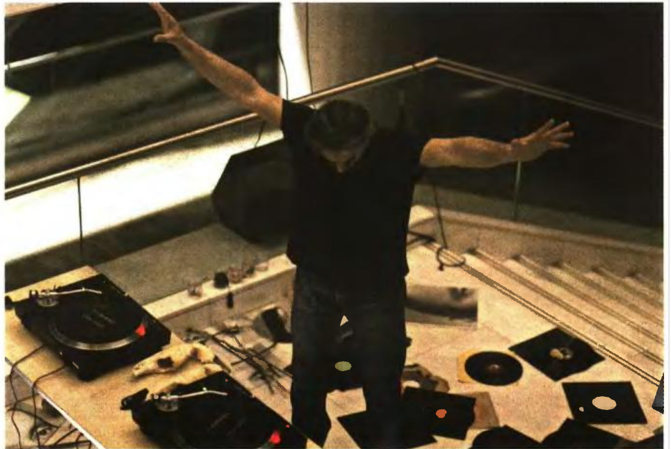
Πάνος Χαράλαμπος, Flatus Vocis , 2017, ηχητικό κείμενιγκ, Μέγαρο Μουσικής Αθηνών, documenta 14

8 Ιουλίου. Επίσκεψη στο «μουσείο ταφικής κουλτούρας» στο Κάσελ. Μια Warburg νεκροφόρα και μια επιγραφή στα