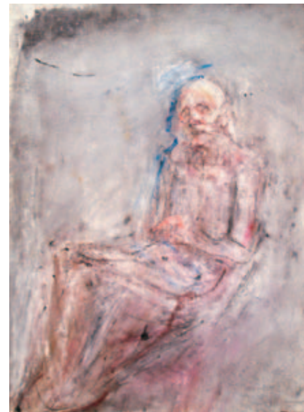
Γριά γυναίκα LXXII, 1985 Ακουαρέλα σε χαρτί arches