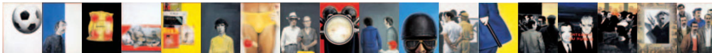
Φρίζα, 1972 18πτυχο Τέμπερα και ακρυλικό σε χαρτί