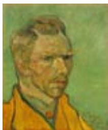
Βαν Γκογκ, αυτοπροσωπογραφία, 1888