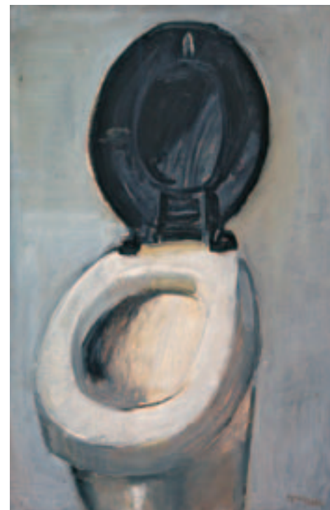
Καμπινές, 1964 Λάδι σε μουσαμά