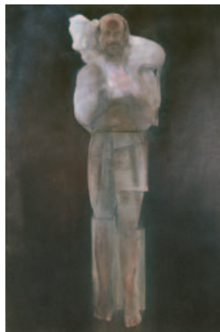
Προσωπική Νέκυια, 1993-2000 Σκόνες αερογραφίας και ακουαρέλα σε χαρτί κολλημένο σε μουσαμά