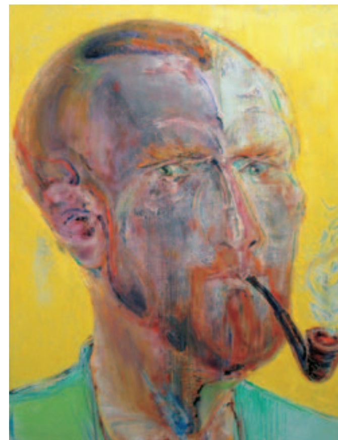
Ο Βικέντιος Βαν Γκογκ καπνίζει την πίπα του, 2009 Λάδι σε μουσαμά