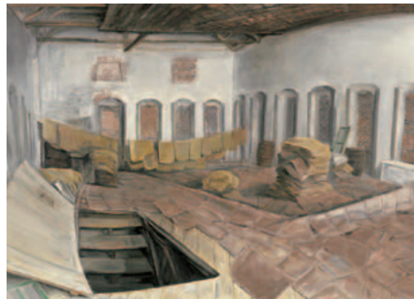
Λιοτριβιό II, 1978 Λάδι σε μουσαμά