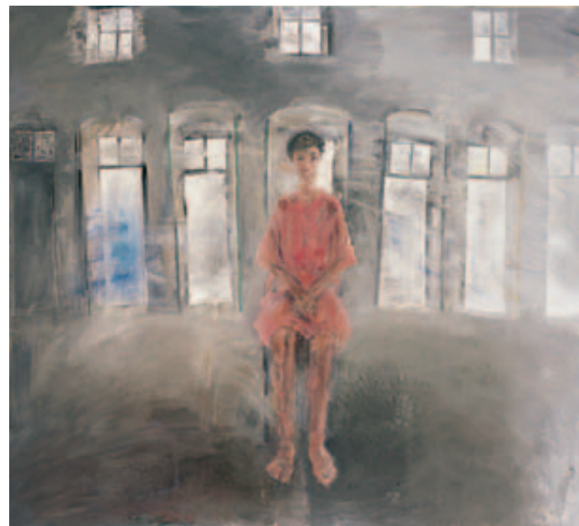
Γυναίκα στο χώρο του λιοτριβιού, 1983 Λάδι σε μουσαμά