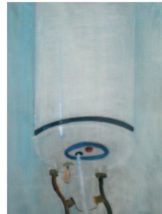
Θερμοσίφωνο, 1963 Τέμπερα σε χαρτί