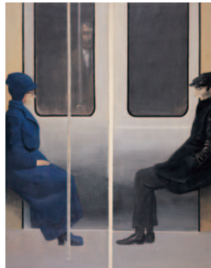
Μετρό Α', 1970 Ακρυλικό σε χαρτί (δίπτυχο)